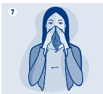
Adults & Children / Adultos y niños / Adultos e Crianças