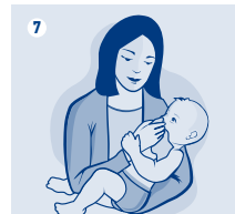
Babies & Children who require assistance / Bebés y niños que requieren ayuda / Bebés e Crianças com necessidade de ajuda

Precautions: For nasal use only. Do not use on more than one individual. Do not use past expiry date. Keep out of reach of children.